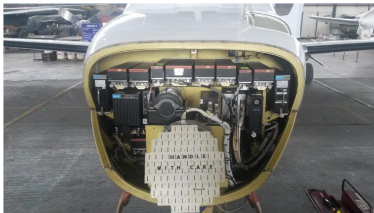
Figura 2. Compartimiento de aviónica actual del avión CESSNA 550 CITATION II IGM-628.