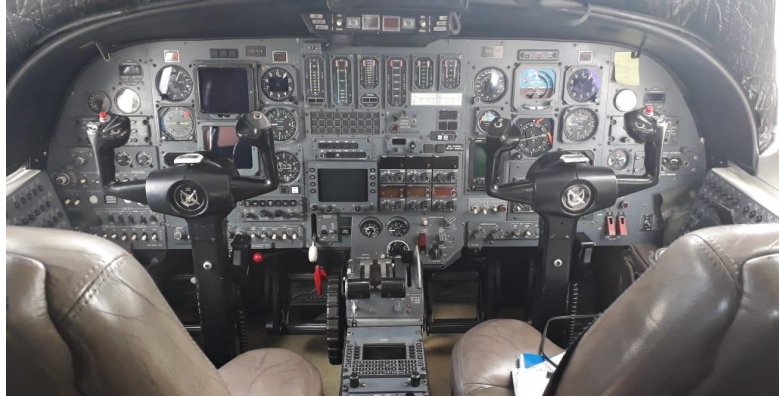
Figura 1. Cabina actual del avión CESSNA 550 CITATION II IGM-628.

A continuación, se muestra una foto de la cabina ( Figura 1 ) y el compartimiento de aviónica actual ( Figura 2 ) que posee el avión CESSNA 550 CITATION II IGM-628.